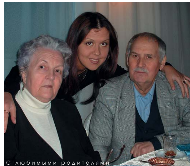
С любимыми родителями

«Я была уверена: чтобы стать счастливой, надо хорошо учиться»