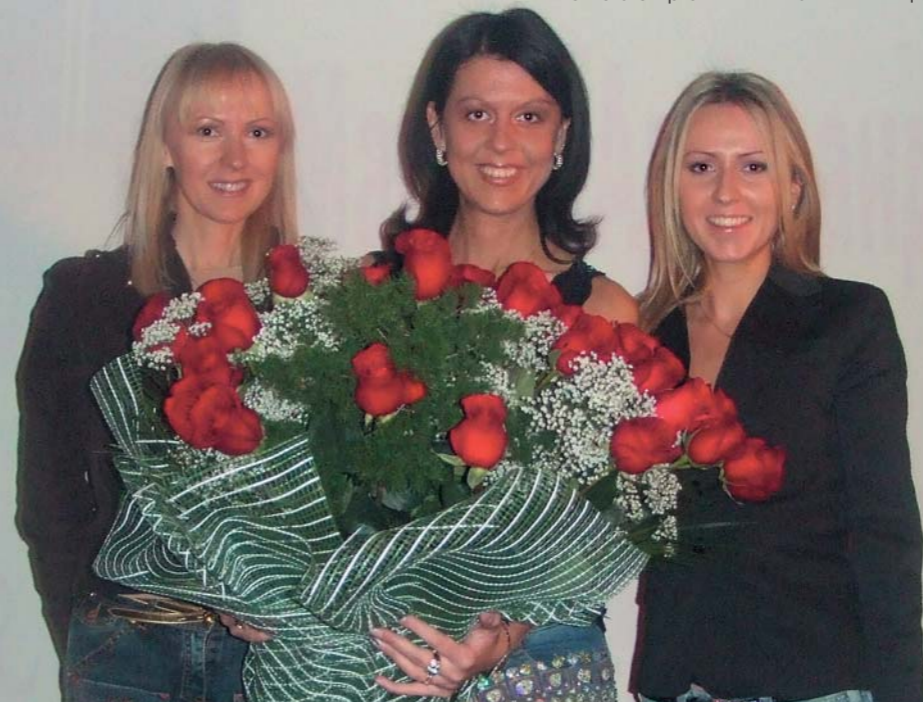
С сестрой и племянницей